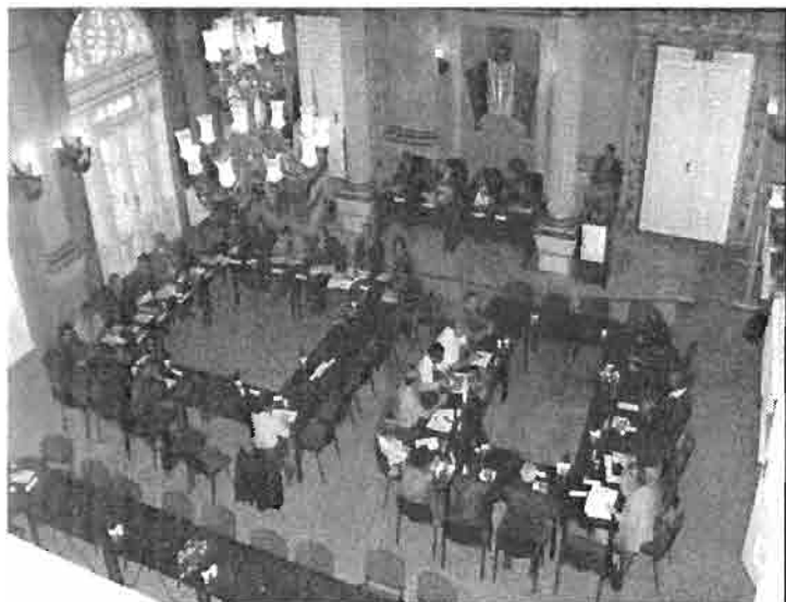
Sesiune de instruire cu PGF-Canada, la Consiliul Local Arad, sala 70, etapa 2003.

De asemenea, funcționarii responsabili au participat și la o sesiune de training organizată la Timișoara, de Academia de Advocacy 1 , asociație non-profit, apolitică și independentă, care sprijină dialogul imparțial între instituțiile societății civile și factorii de decizie în materie de politici publice.