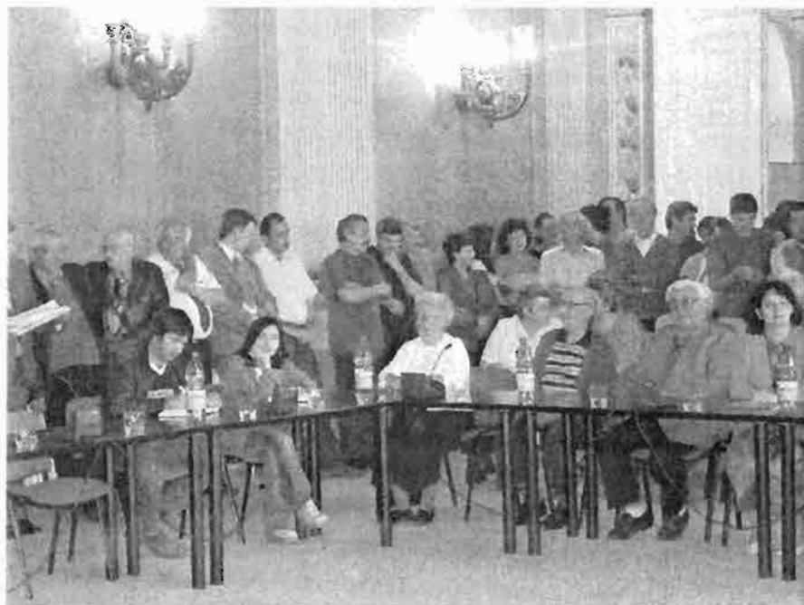
Dezbateri publică impozite și taxe locale 2004

cazul în care s-a constatat o prezență redusă la întrunirea anunțată, s-a decis repetarea dezbaterii, cu o mobilizare mai intensă a potențialilor interesați.